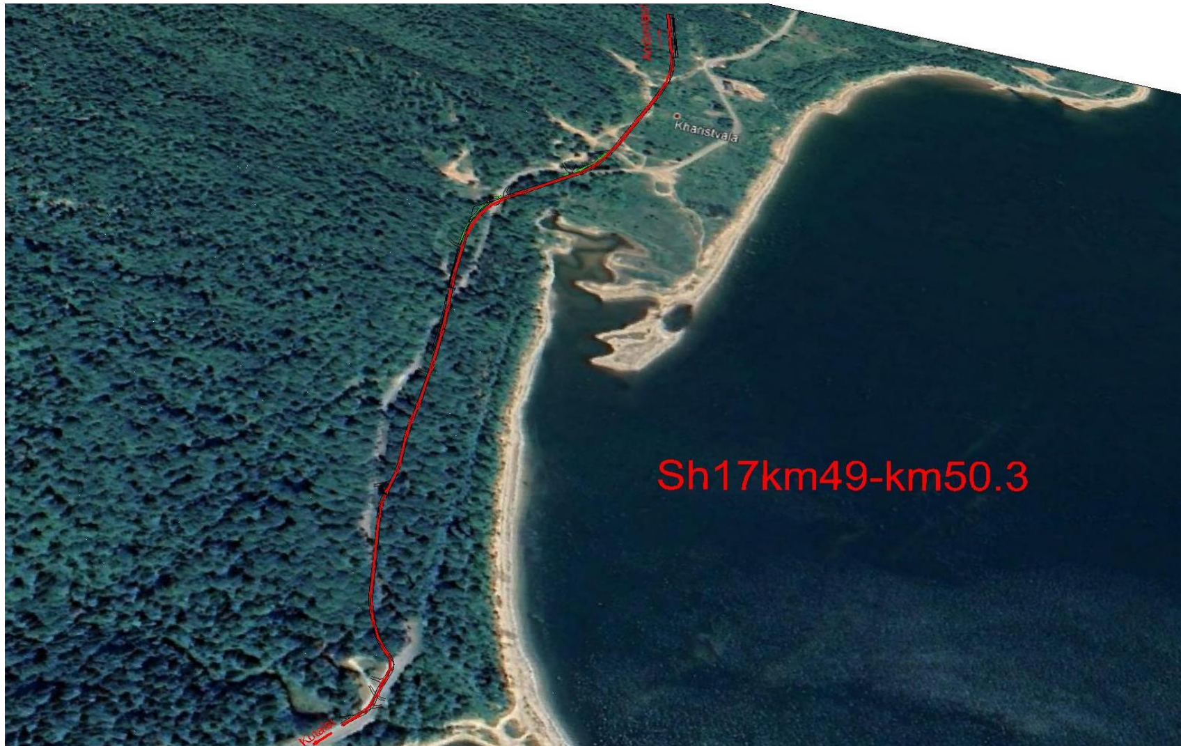
დანართი 1: პროექტის ადგილმდებარეობის რუკა ქუთაისი-ტყიბული-ამბროლაურის გზის (შ 17) მონაკვეთი კმ49-კმ50.3 რეაბილიტაცია